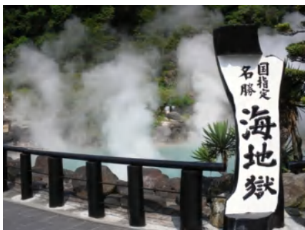
地獄めぐり (海地獄)

お願い / このご旅程は運輸機関のダイヤ改正及び各地の道路状況により多少時間が変更になる場合がございます。 お手数でも現地でも出発時間をご確認下さい。