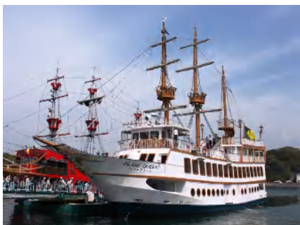
九十九島遊覧船「パールクィーン」

お願い / このご旅程は運輸機関のダイヤ改正及び各地の道路状況により多少時間が変更になる場合がございます。 お手数でも現地でご確認下さい。