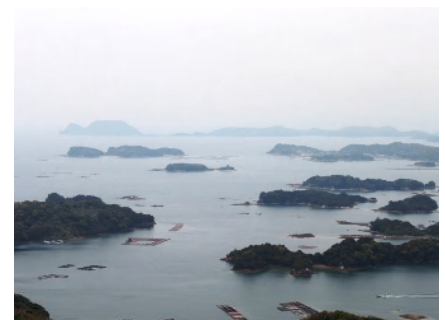
九十九島(石岳展望台からの眺め)